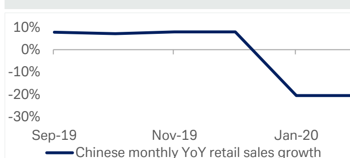
Grafico 2: Vendite al dettaglio in Cina