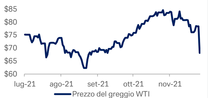
Grafico 2: Prezzo dei future del greggio WTI